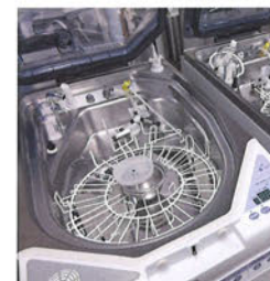
内視鏡洗浄消毒装置