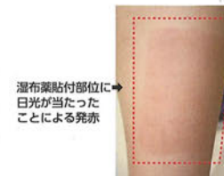
湿布薬貼付部位に日光が当たったことによる発赤

予防策としては、使用部位を紫外線が通りにくい衣類(長袖・長ズボン)、あるいはサポーターで紫外線にあてないよう覆うことが挙げられます。また、使用後少なくとも4週間は紫外線にあてないようにしましょう。症状が出た場合は、直ちに使用を中止し、症状の出た部位を紫外線にあてないようにして、皮膚科専門医を受診しましょう。